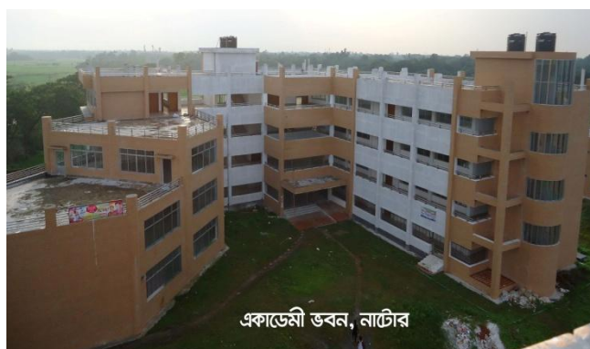
একাডেমিক ভবন, টেক্সটাইল ইনস্টিটিউট, নাটোর