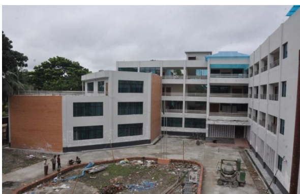
একাডেমিক ভবন, টেক্সটাইল ইনস্টিটিউট, রংপুর

৩। “৪(চার)টি টেক্সটাইল ইনস্টিটিউট স্থাপন” শীর্ষক প্রকল্পটি গত ১৯/১০/২০১০ তারিখে একনেক কর্তৃক অনুমোদিত হয়। প্রকল্পটির সংশোধিত মেয়াদকাল নভেম্বর/২০১০ হতে জুন/২০১৯ এবং মোট বরাদ্দ ২৮৪৭৩.০০ লক্ষ টাকা। জুন/২০১৭ পর্যন্ত প্রকল্পটির ক্রমপুঞ্জিভূত ব্যয় ১২৭৫৯.৭২ লক্ষ টাকা এবং মোট কাজের প্রায় ৪৪.৮১% সমাপ্ত হয়েছে।