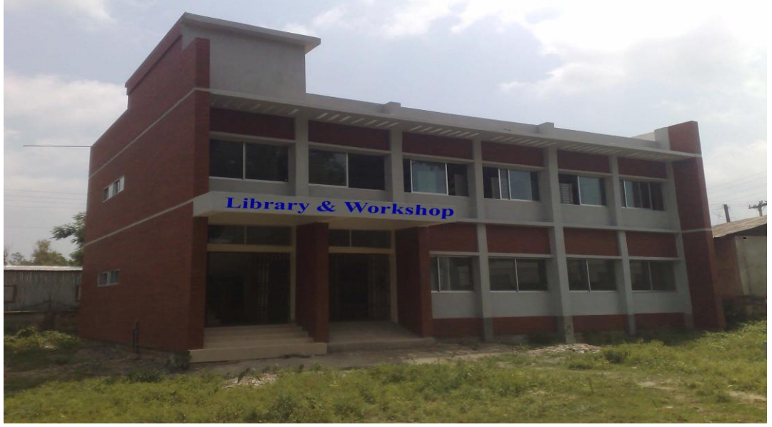
ওয়ার্কশপ-কাম-লাইব্রেরী ভবন, টেক্সটাইল ইঞ্জিনিয়ারিং কলেজ চট্টগ্রাম

৩। “জোরারগঞ্জ টেক্সটাইল ইনস্টিটিউটকে টেক্সটাইল ইঞ্জিনিয়ারিং কলেজে রূপান্তরিতকরণ” শীর্ষক উন্নয়ন প্রকল্পটির সংশোধিত মেয়াদকাল জুলাই/২০০৬ হতে জুন/২০১৪ পর্যন্ত প্রকল্পটি সফলভাবে সমাপ্ত হয়েছে।