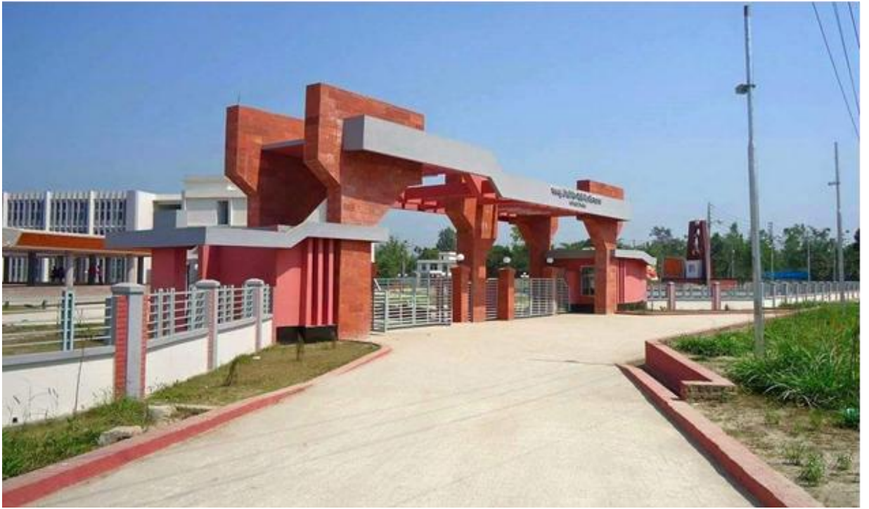
বঙ্গবন্ধু টেক্সটাইল ইঞ্জিনিয়ারিং কলেজ, কালিহাতী, টাংগাইল

৪। “বঙ্গবন্ধু টেক্সটাইল ইঞ্জিনিয়ারিং কলেজ স্থাপন ” শীর্ষক উন্নয়ন প্রকল্পটির সংশোধিত মেয়াদকাল জুলাই/২০০৬ হতে জুন/২০১৪ পর্যন্ত প্রকল্পটি সফলভাবে সমাপ্ত হয়েছে।